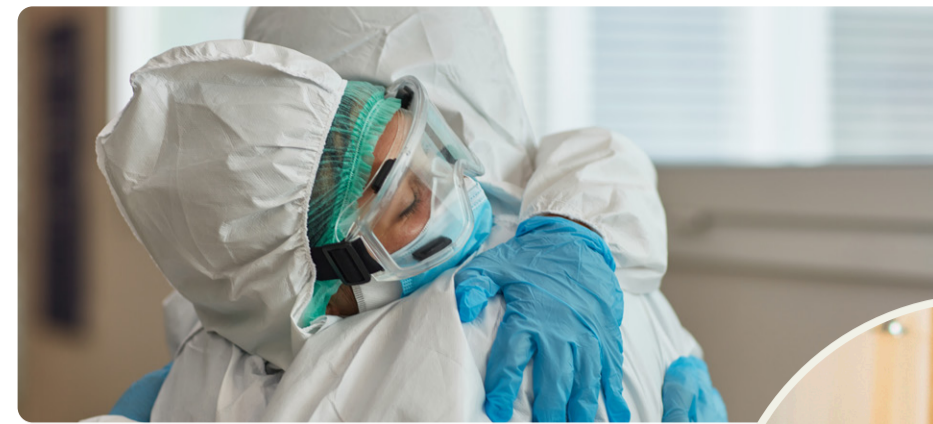
Pandemin visade på bristerna i välfärden. Vänsterpartiet vill bygga samhället starkt igen.

välfärden gav är borta. Skolorna drivs för att tjäna pengar istället för att ge utbildning. Vården har man privatiserat, sålt ut och underfinansierat, så att mindre och mindre pengar finns till läkare och undersköterskor. Skulle vi bli sjuka eller arbetslösa kan vi inte vara säkra på att ersättningen går att leva på. För många äldre, speciellt för många kvinnor, räcker pensionen knappt till mat och hyra och absolut inte till en julklapp åt barnbarnen. Utanför städerna har nedmonteringen gått ännu snabbare, folk har långt till sjukhus, till skolor, till polisen om det skulle hända något. Det är inte någon naturlag